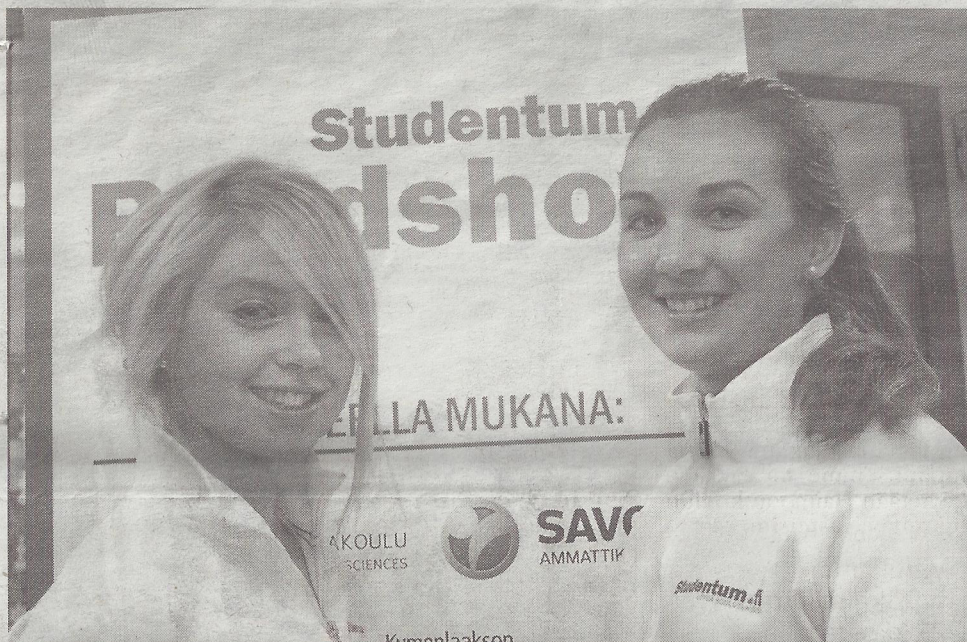
- Kierrämme 40 lukiota, kolme kasarmia ja viidet koulutusmessut, kertovat Studentum-koulu-